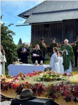
Erntedankfest in Heiligengeist