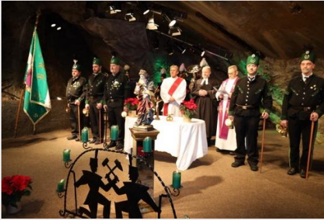
Barbarafeier in der Perschazech