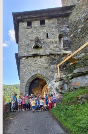
Ausflug zu Burg Finstergrün