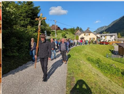
Dekanatsfeier und Wallfahrt im Juni 2024 in Kreuth